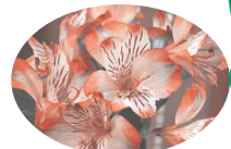
アルストロメリア(ユリ科) 花こぼれ「未来への憧れ」