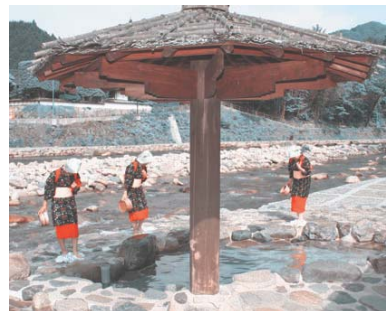
奥津温泉 足踏み洗濯