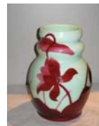
エミール・ガシ 蓮花文花瓶 1900年頃