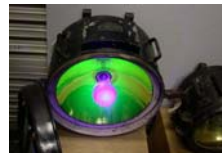
小糸製作所 蒸気機関 車用前照灯 昭和9年 (1934年)