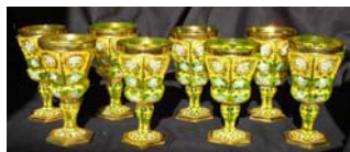
ロシア皇帝愛用のゴブレット 1850年頃