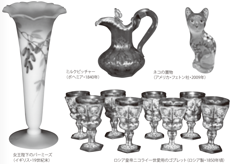
ミルクピッチャー (ボヘミア・1840年)

関係各位に感謝いたしますとともに、この展覧会の開催が、欧米でも日本でも市民世界に深く浸透し、広く愛好されていたウランガラスの広大な世界への入り口となり、その美しさと魅力が一人でも多くの人に伝わることを祈念いたします。